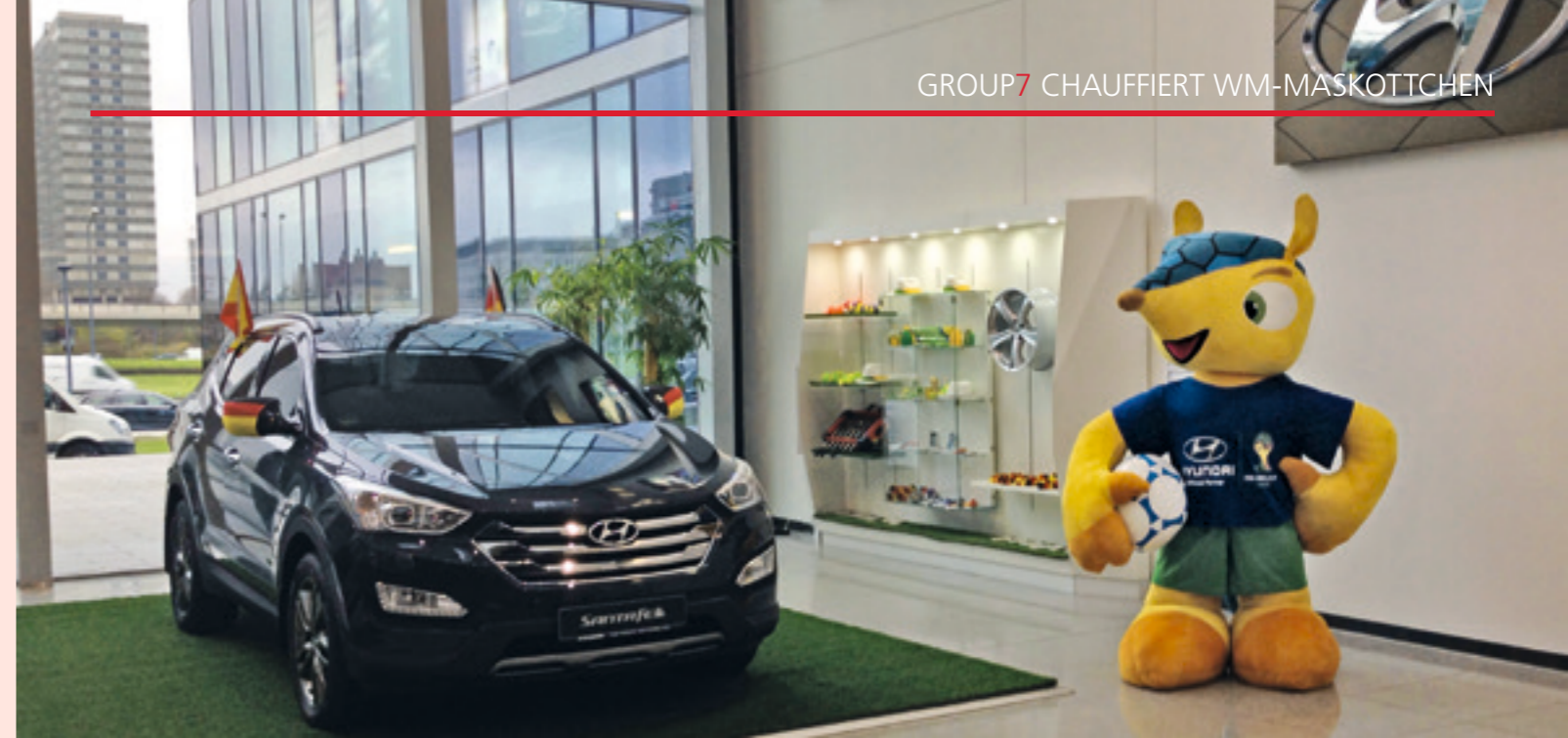
GROUP7 ist ein Spezialist in der europaweiten Distribution von Gütern aller Art

Guess the winner of the forthcoming football championship in Brasil and, with a bit of luck, win one of many attractive prizes. Take part by visiting www.group-7.de and go to the competition page. Our website will provide you with all information you need. GROUP7 wishes you great football evenings and a lot of fun trying to guess the winner!