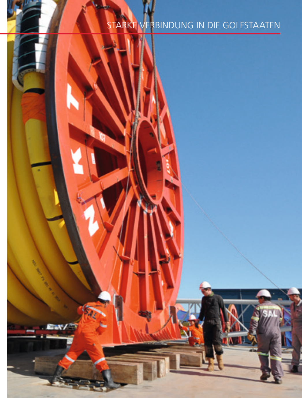
GROUP7 und GAC sind Spezialisten im Handling komplexer Projekte