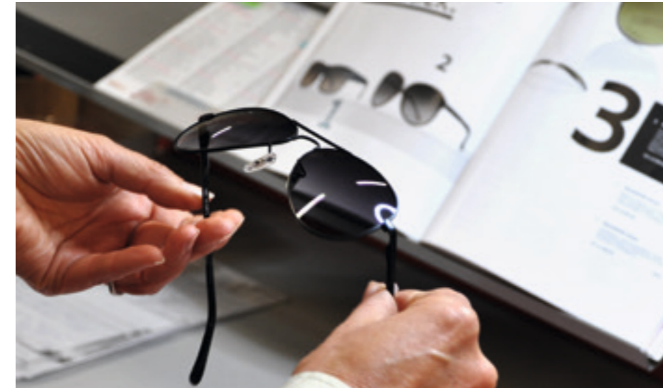
Value Added Services werden in der Kontraktlogistik immer wichtiger

industrie diskutiert wird. Beispielsweise sind wir Mitglied beim Modeverband German Fashion oder beim DTB (Dialog Textilbekleidung). Viele meiner Kollegen und ich selbst bringen jahrzehntelange Erfahrung aus der Textillogistik mit. Das alles versetzt uns in die Lage, unseren Kunden eine zukunftsfähige, flexible Logistik anbieten zu können. Hinzu kommt unsere Stärke im Qualitätsmanagement. Wir setzen beispielsweise Textilspezialisten ein, die bei Lieferanten unserer Kunden extern Prüfungen nach festgelegten Normen durchführen.