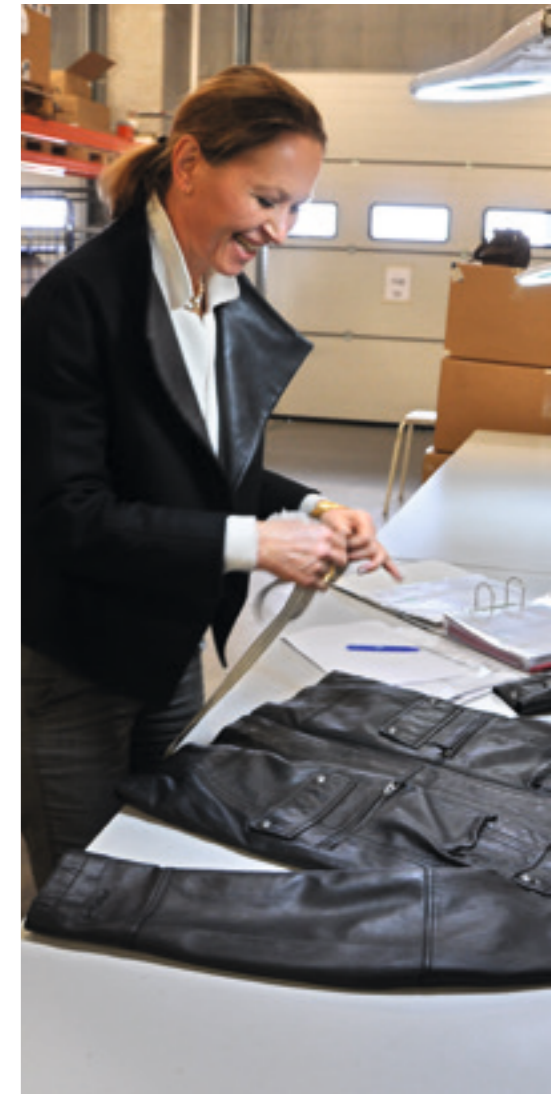
GROUP7 ist Spezialist bei Qualitätsprüfungen