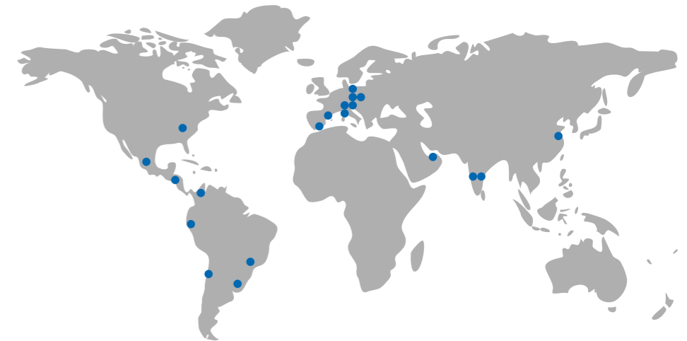
Miebach-Consulting hat weltweit 20 Standorte

Entwicklungen wie Collaboration zwischen Herstellern oder Herstellern und Handel, Erhöhung der Saisonspitzen oder die Zunahme von Aktionen, das ganze Thema POS-Support wie Shelf Readiness, Displays oder die schlichte Zunahme der Artikelvielfalt bis hin zur Kundenindividualisierung – all dies hat immense Auswirkungen auf die Logistik und auf alle Planungs- und Steuerungsprozesse in der Supply Chain.