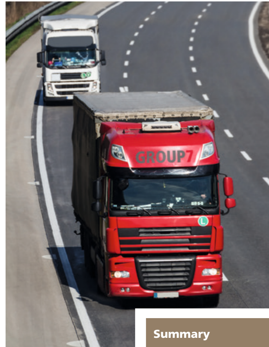
Kunden der GROUP7-Landverkehre profitieren von einem engmaschigen, paneuropäischen Netzwerk

Waren mit einer Länge über 6 Metern, sperrige Ladenbaueinrichtungen, schwere Güter: das alles befördern wir quer durch Europa. Unser Team liebt die Herausforderung und das gilt nicht nur für die Güter selbst. Auch die just in time Anlieferung der zu verbauenden Projektgüter an Baustellen gehört zu unseren Stärken.