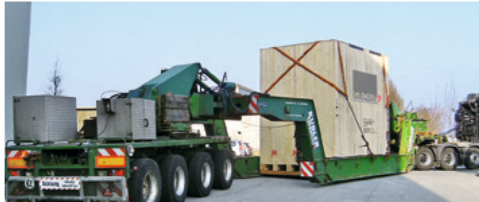
Mit dieser Kesselbrücke erreichte die GROUP7-Ladung per Sondertransport sicher das Binnenschiff in Mannheim