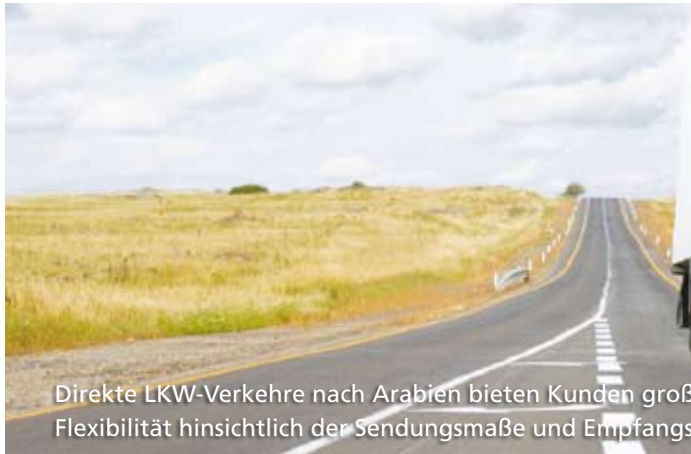
Direkte LKW-Verkehre nach Arabien bieten Kunden große Flexibilität hinsichtlich der Sendungsmaße und Empfangsadressen

Eine lohnende Alternative zur Luftfracht