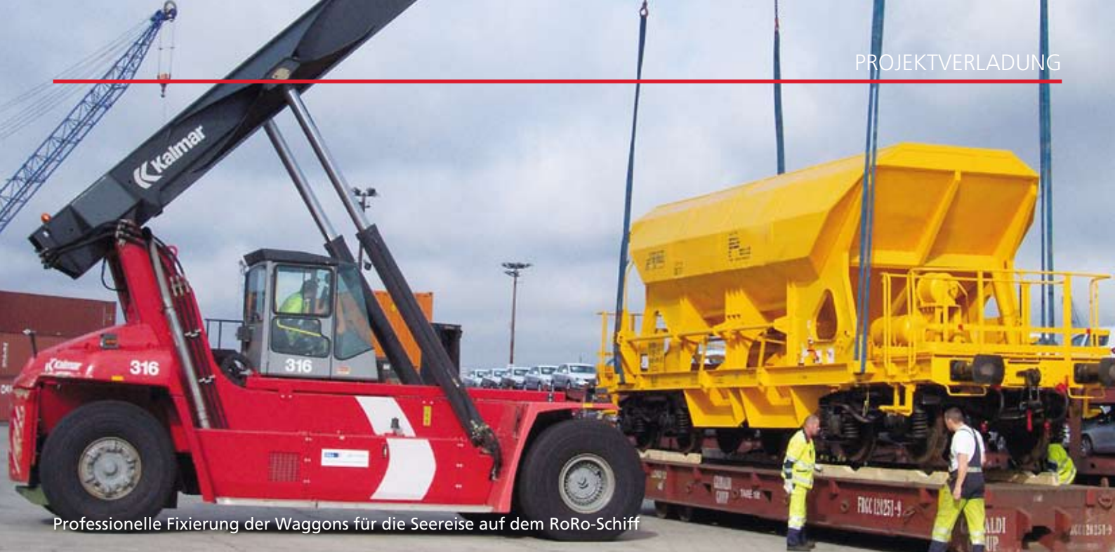
Professionelle Fixierung der Waggons für die Seereise auf dem RoRo-Schiff