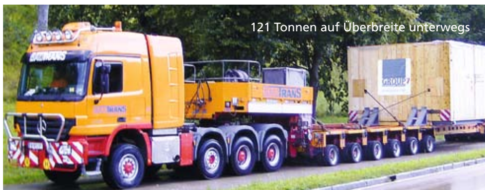
121 Tonnen auf Überbreite unterwegs

Hartnäckige Verhandlungen mit Behörden sichern termingerechte Ankunft