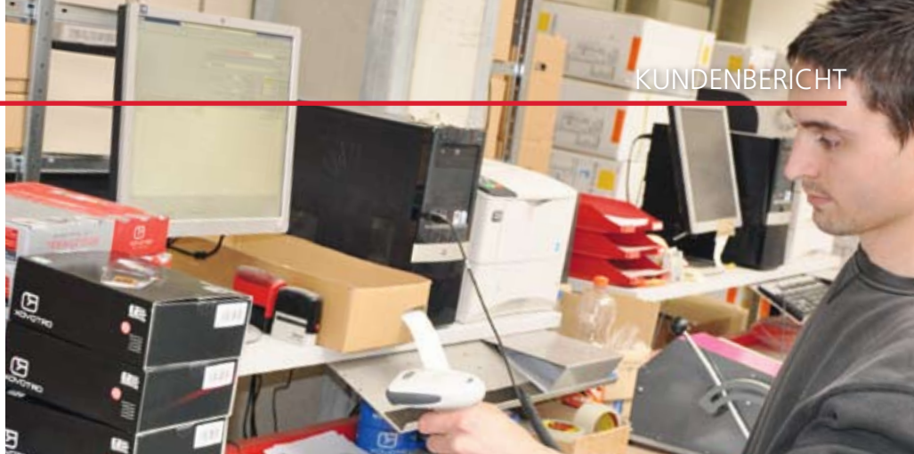
Kommissionierung von Ortovox-LVS-Geräten bei GROUP7