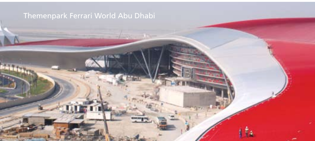
Themenpark Ferrari World Abu Dhabi

231,000 m 2 (2,486,463 ft 2 ) of metal, a weight of more than 900 tons (992 US tons) and 100,000 liters (26,417 gallons) of paint – these are the key figures of the largest roof in the world in Abu Dhabi. Our GROUP7 team in Stuttgart organized the transport of roll shapers, thermal holders and other structural components by air freight and ocean freight for the Ferrari Theme Park.