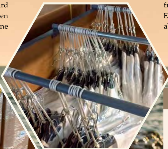
Transport von Hängeware

der sozialen Standards und der Arbeitsbedingungen in der weltweiten Wertschöpfungskette ist. Mit der Unterzeichnung des BSCI-Verhaltenskodex, welcher die Anforderungen an eine sozial gerechte Produktion zusammenfasst, verpflichten sich Unternehmen, in ihrem Einflussbereich soziale Kriterien, die diesem Verhaltenskodex zu Grunde liegen, anzuerkennen und geeignete Maßnahmen zur Umsetzung und Einhaltung im Rahmen ihrer Unternehmenspolitik durchzuführen. Hierzu gehören u. a. Vorgaben zum Verbot von Kinder- und Zwangsarbeit ebenso wie von Diskriminierung, zu Vergütung und angemessenen Arbeitszeiten, zu Arbeits- und Umweltschutz, zur Verhinderung von Korruption und schließlich zur Vereinigungsfreiheit sowie Kollektivverhandlungen. Die Einhaltung dieser Kriterien wird von unabhängigen Dritten regelmäßig überprüft.