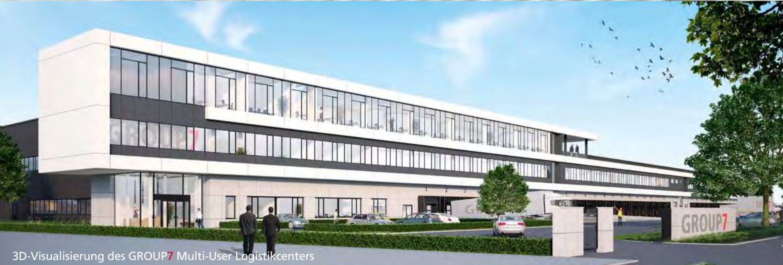
3D-Visualisierung des GROUP7 Multi-User Logistikcenters