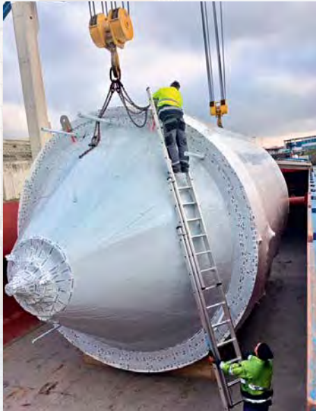
Transport eines Tanks für die Milchindustrie von Deutschland nach Israel