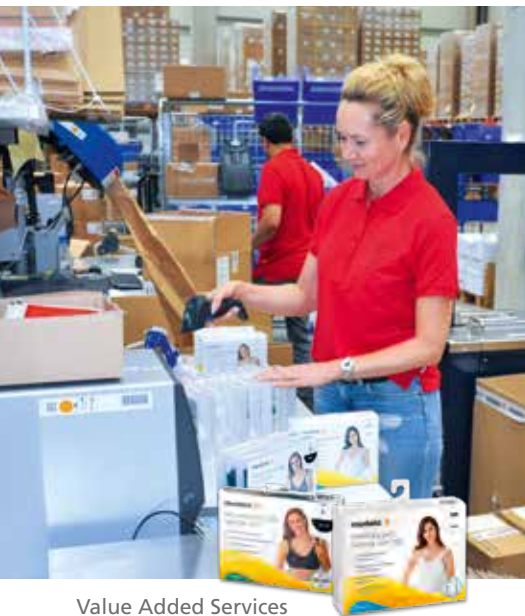
Value Added Services

„Wir beobachten unsere gesamte Lieferkette sehr genau und bewerten Situationen kontinuierlich. Medela arbeitet mit ihren Lieferanten und Partnern sehr eng zusammen um die pünktliche Lieferung der Produkte und einen weiterhin sicheren Produktionsprozess zu gewährleisten. Dabei spielt für uns nicht nur in einer Zeit, wie in den letzten Monaten der Pandemie